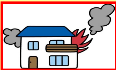
【火災、落雷、破裂・爆発】