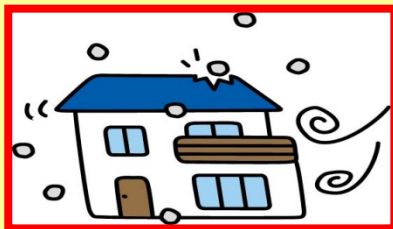
【風災、雹(ひょう)災、雪災】